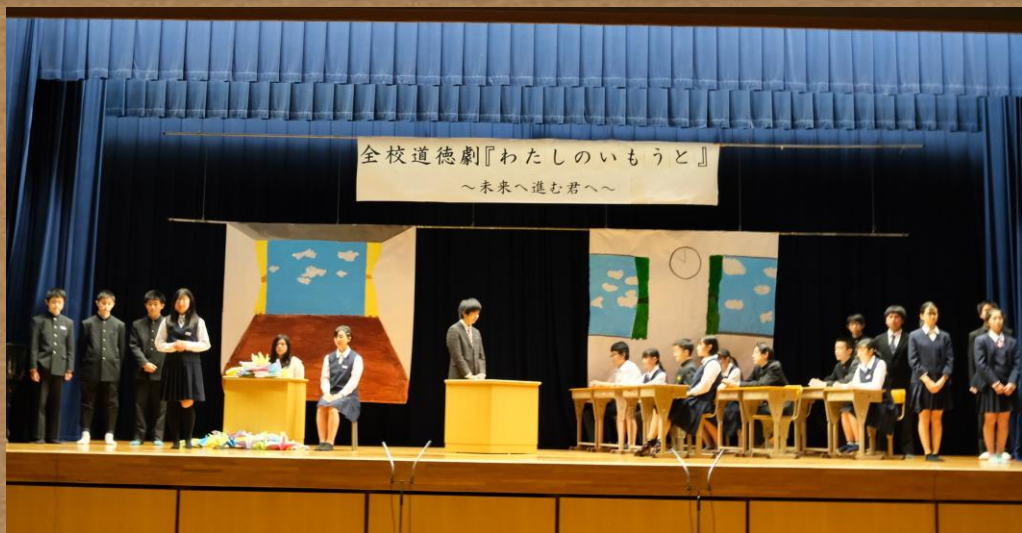
全校道徳劇の様子

新堂中学校では、日々お互いを大切にし合える仲間づくりをめざしています。また、道徳や人権学習ではよりよい生き方や命の大切さ、いじめに関わる授業も行っています。6月・9月のいじめ防止啓発強化月間や、毎月の人権の日を有効に活用し、いじめについてクラス全体で考えています。また、いじめにつながりやすいSNSやスマートフォンの使い方についても学習します。