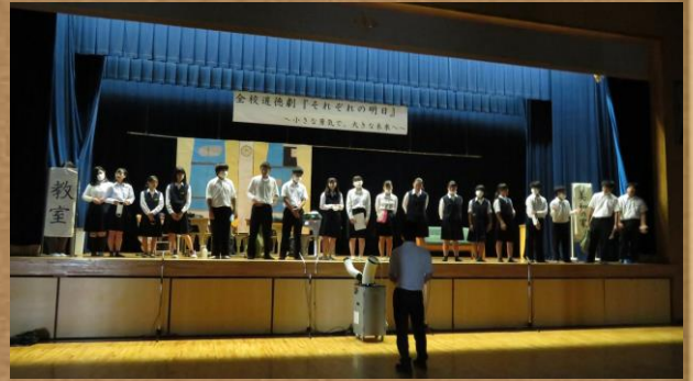
全校道徳劇の様子